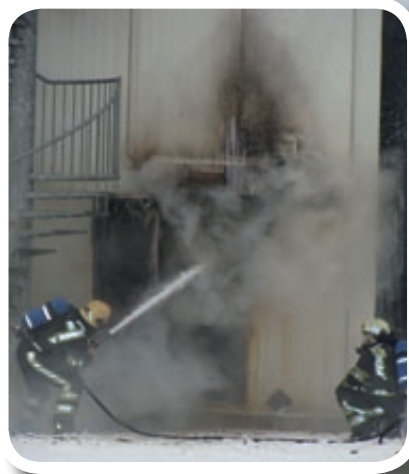
De brand in de productieoven zorgde voor een enorme rookontwikkeling met achteraf gezien een schade met ingrijpende gevolgen.